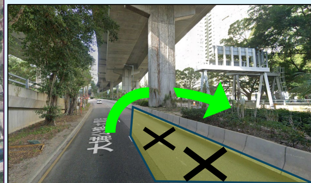
近美林邨將設新的調頭位置