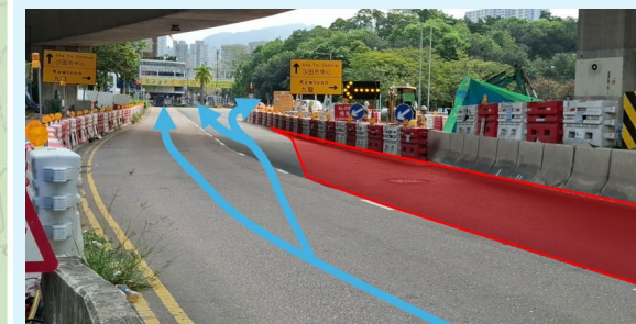
大埔公路-大圍段東行部份快線臨時封閉